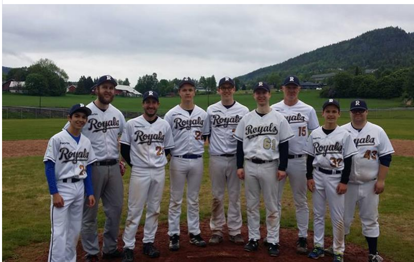
ØHIL Royals A – vinnere av NBL2 Øst