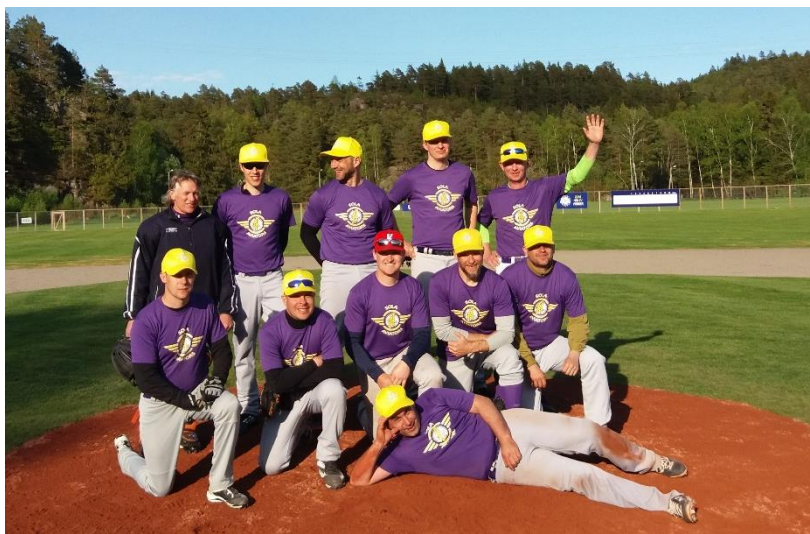
Sola Aviators – vinnere av NBL2 Vest